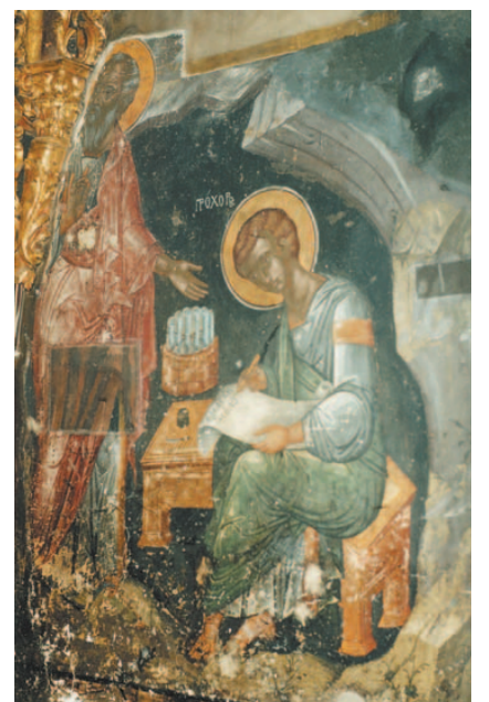
Prochoros kirjoitti ylös Johanneksen näkemät näyt.