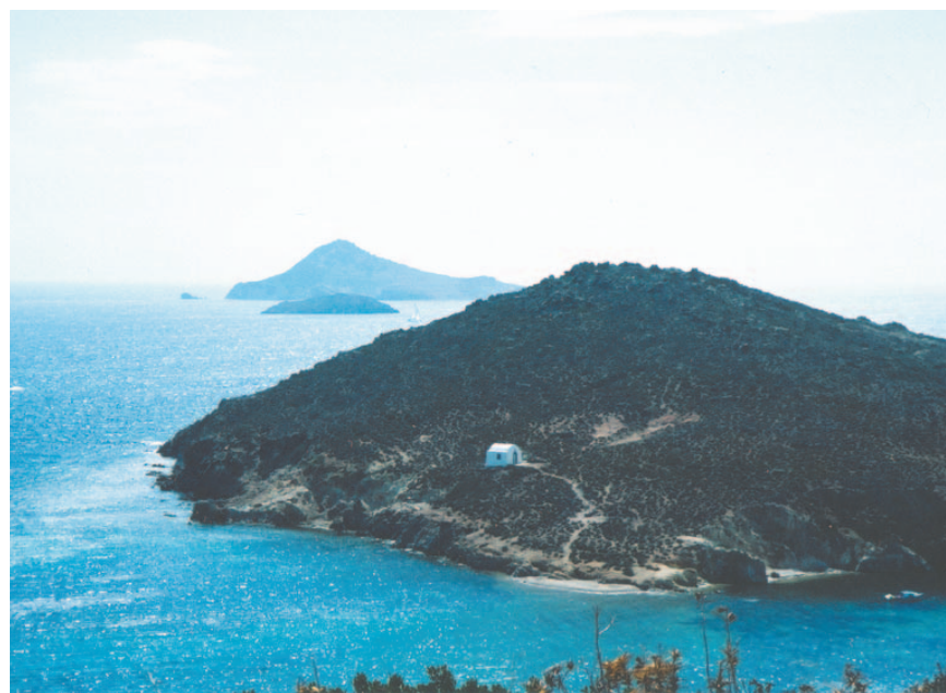
Patmoksella elää 30 munkkia Yksinään pikku luostarissa asuva munkki lähtee kerran viikossa kotoaan noutamaan ruokaa.

Patmoksen saaren keskeisin vaikuttaja jo lähes tuhannen vuoden ajan on ollut sen huipulla sijaitseva Johannes Teologin luostari. Sen rakentaminen alkoi vuonna 1088, kun Bysan-