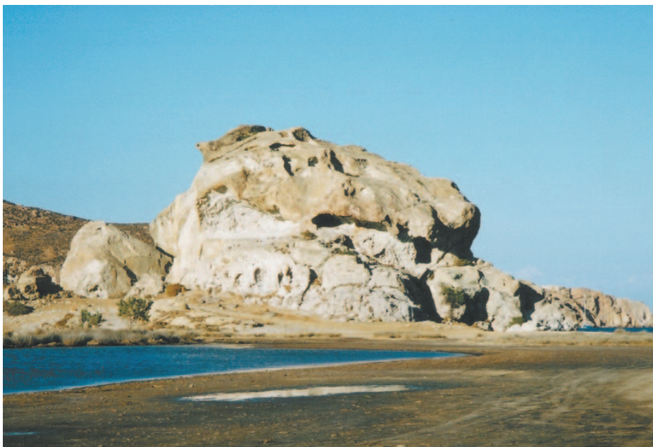
Petran luolia, joihin pyhät kirjoitukset vietiin merirosvoilta piiloon.

Sanan lukijamatkan kotisivu www.ecredo.fi/patmos